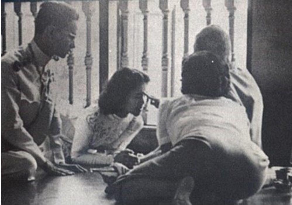
วันที่ ๒๘ เมษายน ๒๔๙๓ พระราชพิธีราชาภิเษกสมรส สมเด็จพระพันวัสสาอัยยิกาเจ้า พระราชทานน้ำพระมหาสังข์ ณ วิังสระปทุม