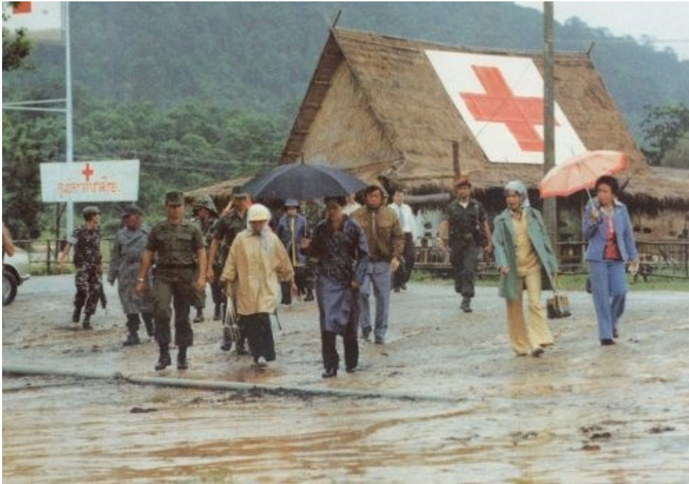
สมเด็จพระนางเจ้าสิริกิติ์ พระบรมราชินีนาถ พระบรมราชชนนีพันปีหลวง สภานายิกาสภาอากาศไทย