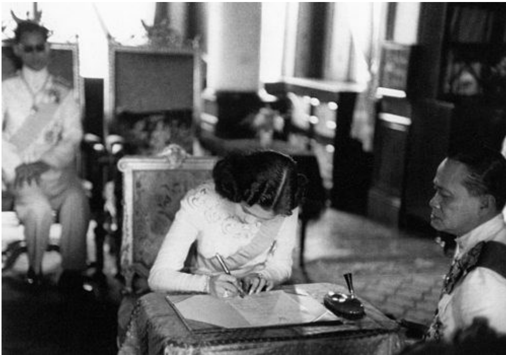
วันที่ ๒๘ เมษายน ๒๔๙๓ ทรงลงพระนามาภิไธย ในสมุดทะเบียนสมรส

ต่อมาอีก ๑ ปี ทรงพระกรุณาโปรดเกล้าโปรดกระหม่อมให้หม่อมเจ้านักขัตรมงคลและครอบครัวมาเฝ้าทูลละอองธุลีพระบาท แล้วสมเด็จพระราชชนนีรับสั่งขอหม่อมราชวงศ์สิริกิติ์ ต่อหม่อมเจ้านักขัตรมงคลและทรงประกอบพิธีหมั้นเป็นการภายใน ในวันที่ ๑๙ กรกฎาคม พุทธศักราช ๒๔๙๒ ทรงใช้พระอำนาจที่สมเด็จพระราชบิดาทรงหมั้นสมเด็จพระ