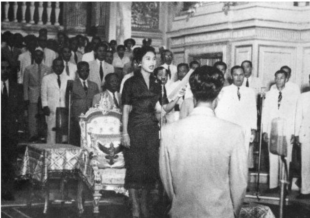
พระบาทสมเด็จพระบรมชนกาธิเบศร มหาภูมิพลอดุลยเดชมหาราช บรมนาถบพิตร เสด็จออกทรงผนวช จึงทรงพระกรุณา โปรดเกล้าโปรดกระหม่อมแต่งตั้งสมเด็จพระนางเจ้าสิริกิติ์ พระบรมราชินีนาถ พระบรมราชชนนีพันปีหลวง เป็นผู้สำเร็จราชการแทนพระองค์ ในภาพนี้ทรงปฏิบัติพระองค์ในรัฐสภา ณ พระที่นั่งอนันตสมาคม เมื่อวันที่ ๒๐ กันยายน ๒๕๕๕