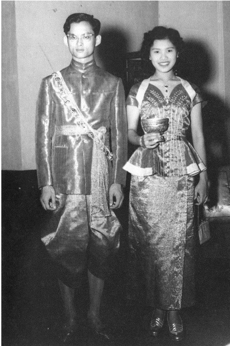
สมเด็จพระนางเจ้าสิริกิติ์ พระบรมราชินีนาถ พระบรมราชชนนีพันปีหลวง ทรงเชิญดอกพิกุลเงิน ดอกพิกุลทอง และเหรียญสลึง ถวายพระบาทสมเด็จพระบรมชนกาธิเบศร มหาภูมิพลอดุลยเดชมหาราช บรมนาถบพิตร เพื่อ ทรงโปรยพระราชทานแก่ข้าทูลละอองธุลีพระบาทฝ่ายใน